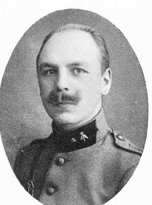
RAICK, Félix, né le 4 décembre 1887, à Liège.

Officier d'une grande bravoure et d'un grand dévouement. Terrassé par une maladie contractée en service, succomba, à Muaza, le 21 octobre 1916.