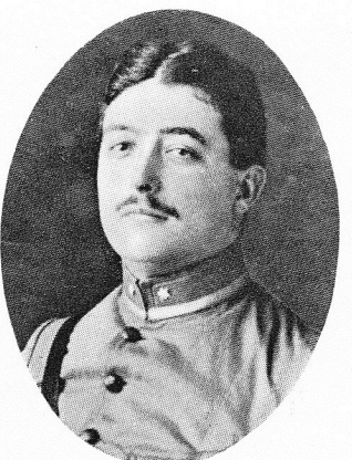
PIERS de RAVESCHOOT, Alfred, né le 24 mai 1870, à Gand.

Étant aux colonies lors des événements de 1914, se mit à la disposition du gouverneur. Chargé de la défense de Kissegnies, il s'y battit avec héroïsme, tomba frappé, après une journée de lutte, le 4 octobre 1914.